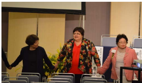
パイロットの歌を輪になって