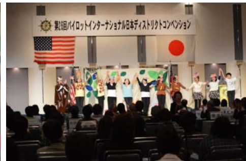
DAC役員による紙芝居実演