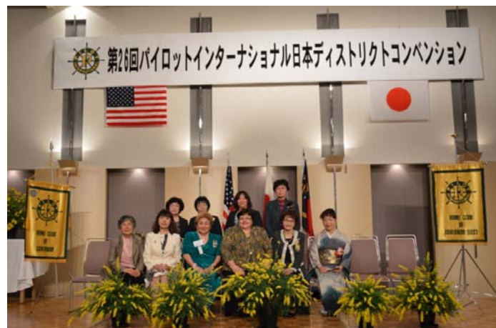
ホスティングクラブ びわこPC お世話になりました。