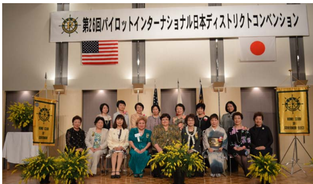
2015-16年度ディストリクトチーム お疲れさまでした。