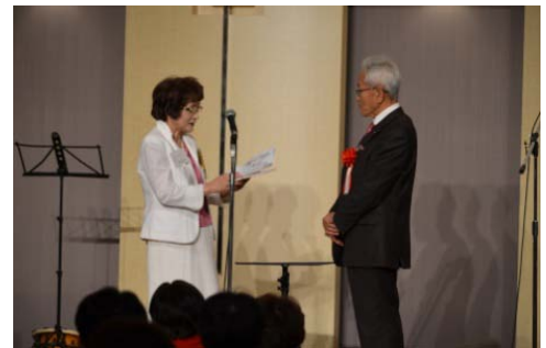
寄付贈呈 スペシャルオリンピックス日本