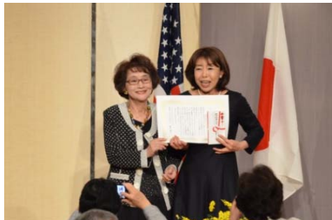
日本ディストリクト助成金授与 マルベリー東京PC