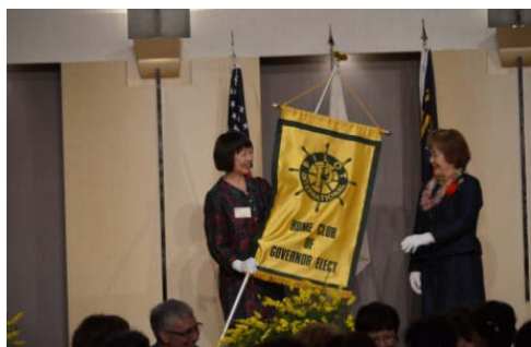
ガバナーエレクト旗 引継ぎ さつまPC → 東京PC