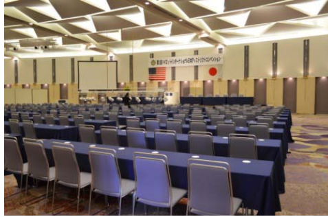
会場：プリンスホールA