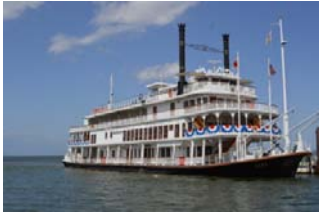
ランチバイキング & ミシガンクルーズ