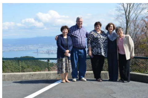
比叡山ドライブウェイ