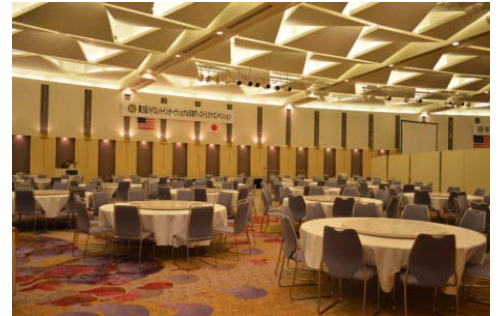
会場：プリンスホールB