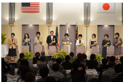
ディストリクトチームの就任