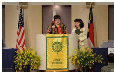
PI役員就任（PI役員就任の認証）