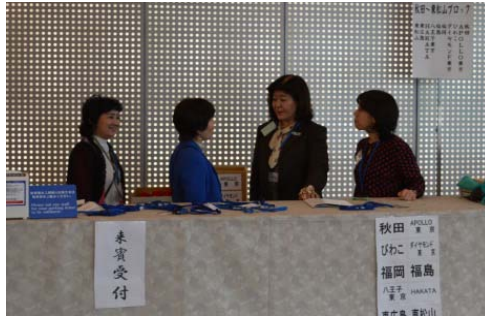
各種委員会打ち合わせ