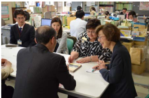
滋賀県 健康福祉課訪問