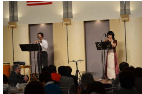
オープニング よし笛 (レイクリード)