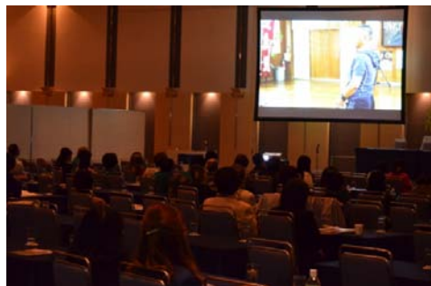
映画「幸せの太鼓を響かせて-INCLUSION-」