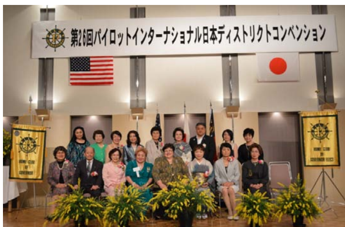
2016-17年度ディストリクトチーム よろしくお願いいたします。