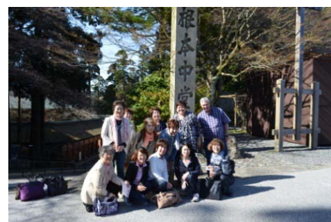
比叡山延暦寺にて