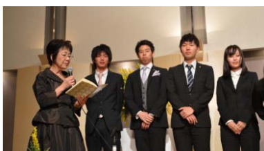
最優秀賞 高崎アンカークラブ 優秀賞 IBU大阪アンカークラブ 努力賞 東京アンカークラブ 鹿児島アンカークラブ