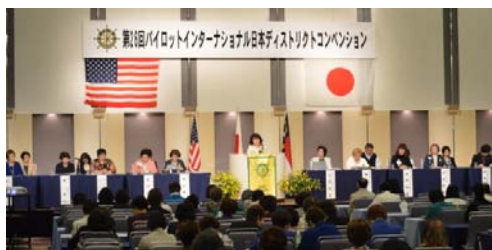
2016-17年度活動方針の発表