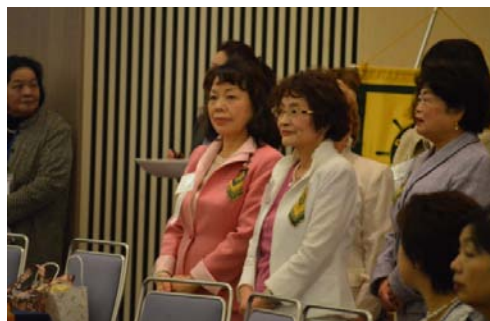
ラインナップ入場