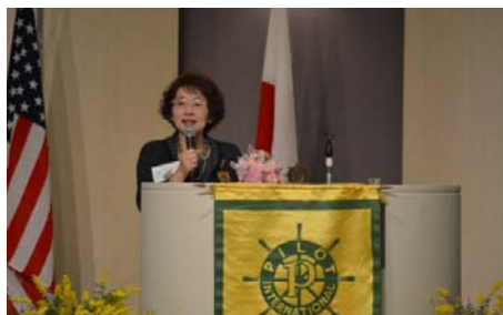
ガバナースピーチ 檜山博子