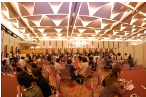
全国のクラブより名産のお菓子を頂きました♪