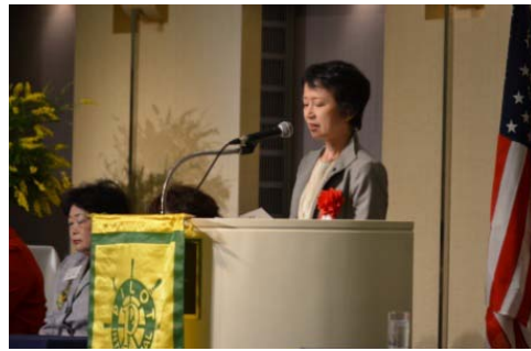
滋賀県 池永肇恵 副知事 祝辞