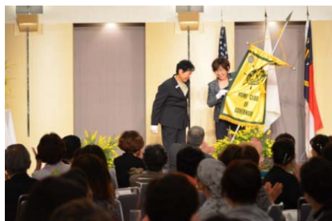
ガバナー旗 引継ぎ 三原PC → さつまPC