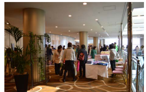
販売ブースの準備