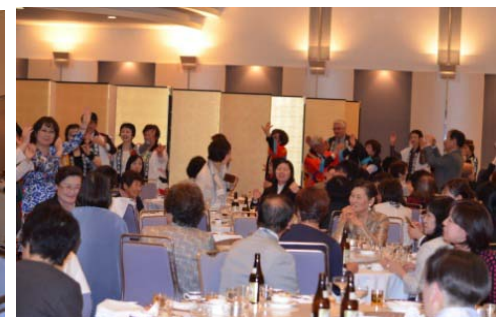
太鼓に合わせて江州音頭を皆さんと一緒に踊りました