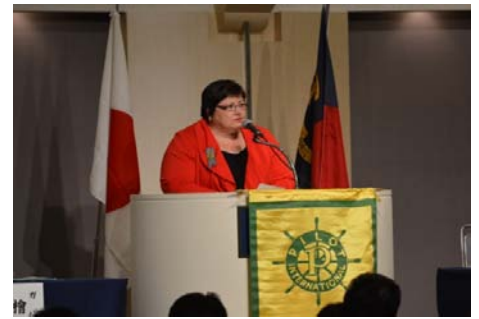
ゲスト祝辞 PI会長 シャノンクレッグ