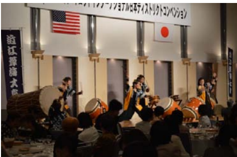
和太鼓 (近江葦海太鼓)