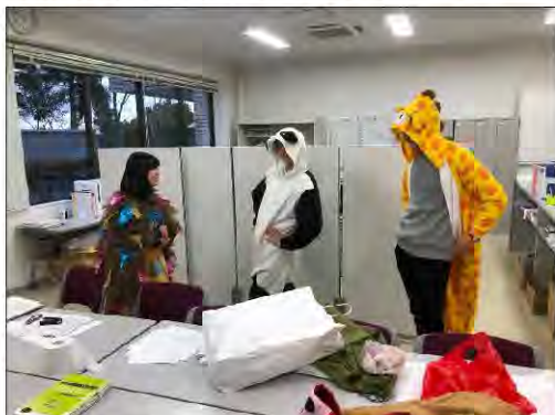
フレインマインダース練習風景