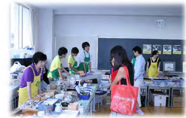
文化祭にてチャリティーバザー（桜東京PCのみなさまも応援参加） 〈資金調達活動&スポンサークラブとの協力〉