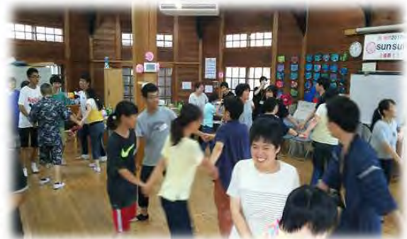
心身障がい者デイケア施設 ほっとすてーしょん 〈脳関連障がいボランティア活動〉