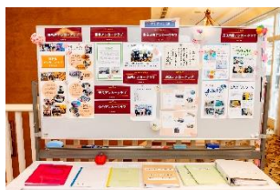
コンベンション展示物