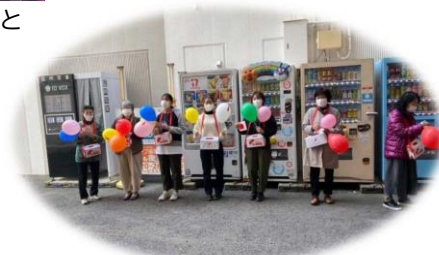
地域への奉仕 赤い羽根運動